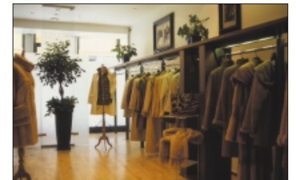
Boutique de mode spécialisée dans la fourrure

Les vêtements en fourrure, les vêtements associant fourrure et textiles («mixtes») et ceux garnis de fourrure sont fabriqués à travers le monde entier. Les vêtements et les accessoires en fourrure sont aujourd'hui commercialisés à travers de nombreux points de vente: magasins de fourrure, grands magasins et boutiques de mode.