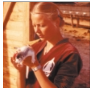
Apprivoisement précoce du jeune vison